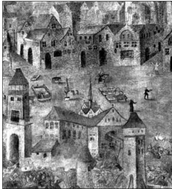
Obr. 17 Jihlava, minoritský kostel, detail fresky zachycující scénu ze začátku 15. stol., domy s horním arkádovým obloukem.

Spolu s kostelem vyrůstaly i stavby konventu, které byly řazeny ze západní strany a vyplňovaly pozemek až k hlavní hradební zdi. Do konce 13. století stála asi kapitulní síň o čtyřech polích klenby, přiléhající místnosti a část ambitu.