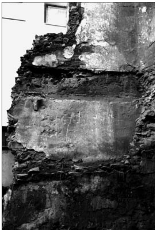
Obr. 11 Jihlava, dům č. 48 na náměstí, otisky po odbourané části raně středověkého domu.

V nedávné době byla objevena i část podloubí domu č. 4, na fragmentu udívuje poměrně značná výška dlažby loubí, ještě dnes asi 0,5 metru nad náměstím, a poloha piliře – ustupuje o 2/3 pole, velmi pěkně je zde zachován otisk čelní zdi objektu a v průjezdu opět nezbytné sedile. V č. 7 bylo při poslední rekonstrukci otevřeno pole s čelním obloukem arkády, který překvapuje svou výškou. Jedná se o nárožní dům, který zachovával niveletu dlažby loubí a byl tedy nutně značně vysoko nad náměstím – přes jeden metr. Raně gotické jádro bylo objeveno i u domu č. 13, v průjezdu napravo se nachází sedile s kamennými konzolkami střídavě zdobenými tesaným reliéfem a zděnými konzolkami podobného tvaru, snad pozůstatkem sloupků. Proti nim byla objevena dvě úzká okénka ze zadní komory, ve sklepě je opět zachován půlkruhový portálek s hranou tvořenou půlkruhovým výžlabkem přecházejícím do běžnějšího okosení. Dům byl široký 9 metrů a hluboký 26 metrů. K nejnovějším nálezům loubí patří odhalené zbytky piliřů v domě č. 1 a 2 (součást budovy radnice).