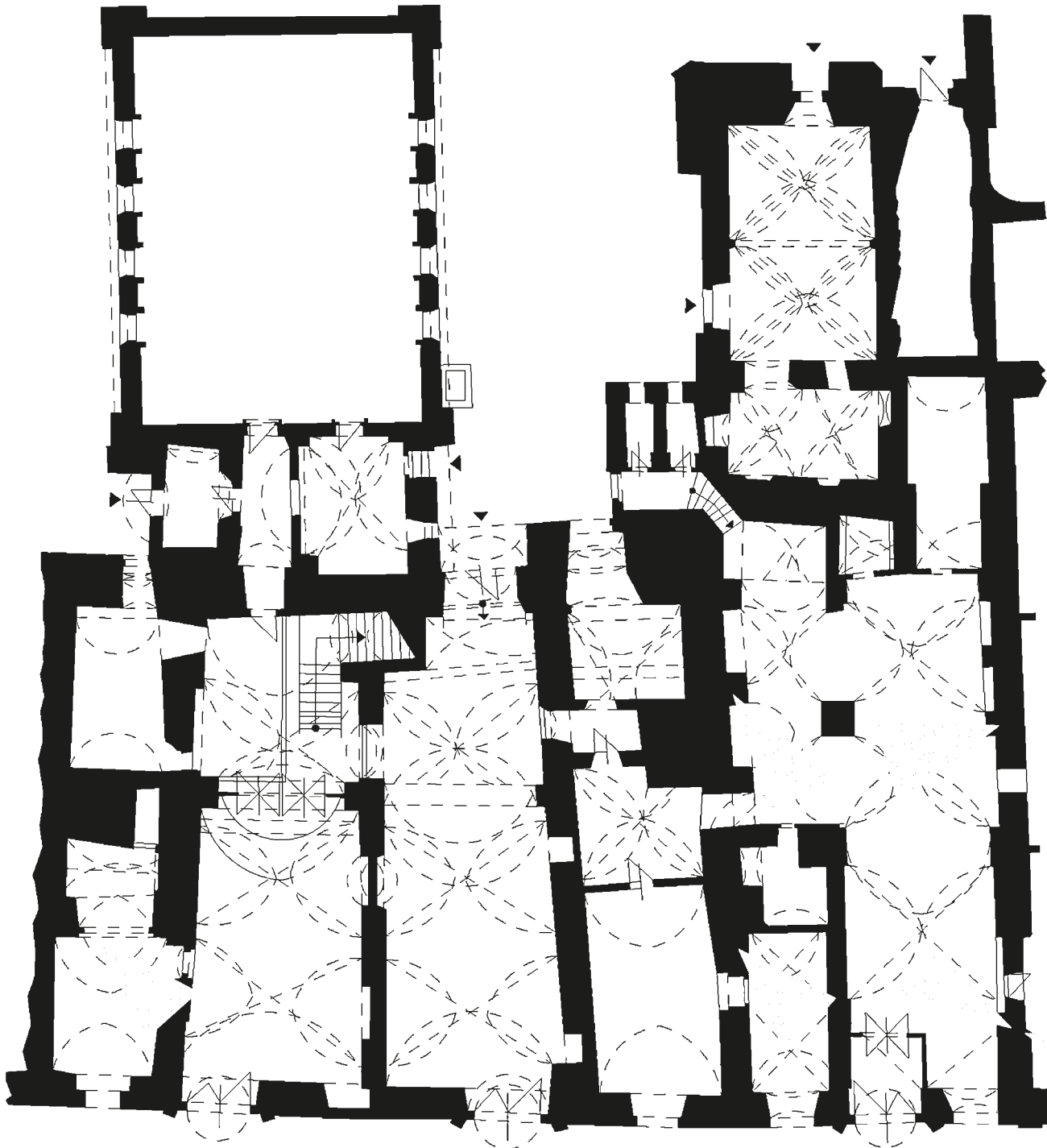
Obr. 9 Jihlava, radnice, schéma nálezů zbytků domů ze 13. století.

Dalším jedinečným městským domem je č. 48 na západní straně náměstí, který byl do začátku 15. století radnicí. Městiště domu sahala podle písemných zpráv přes celou délku bloku a kamenná stavba 13. století obsahovala čelní loubí, za ním patrně dvoulodní podélný prostor zastropený dřevěným stropem. V zadní, v roce 1977 odbourané části navazovala velká komora ve zvýšeném přízemí zastropená dřevěným stropem se dvěma podpůrnými konstrukcemi – hlavní nosný trám spočíval na kamenné konzole vysoké asi 60 cm (dnes v muzeu), na něm ležely vlastní stropní trámy a prkna, boky byly bedněny. Strop byl ukládán souběžně při zdění stavby, takže se zřetelně zachovaly otisky bočních bednicích prken i s letokruhy. Prkna byla stavěna kónicky, což svádělo k domněnce, že šlo o dřevěnou klenbu. Rozsah zástavby ze 13. století jde do hloubky téměř 30 metrů (obr. 10, 11).