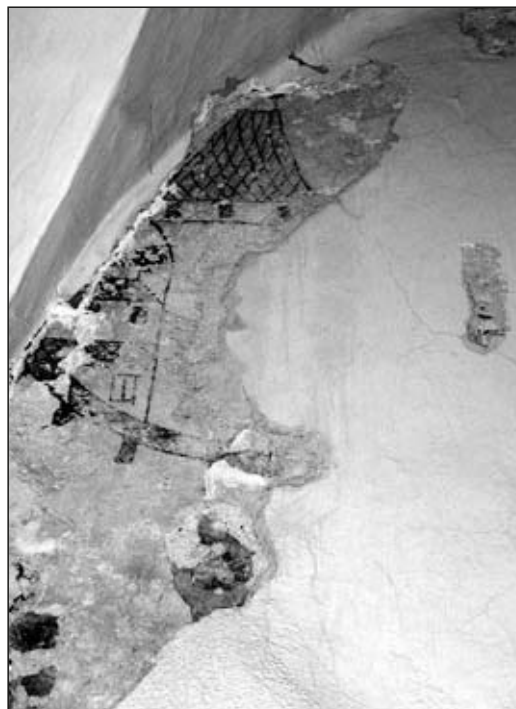
Obr. 14 Jihlava, dům č. 1, přízemí, nález fresky.

Pro úplnost výkladu o raně gotické podobě města je nutné zmínit i stavby církevních budov, především tři velkých komplexů: děkanského chrámu s farou, minoritského kláštera s kostelem Nanebevzetí P. Marie a dominikánského kláštera s kostelem sv. Kříže. Je totiž pravděpodobné, že stavební huti se mohly podílet i na výpravnějších světských stavbách.