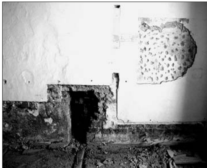
Obr. 13 Jihlava, dům č. 1, patro, nález nárožního bloku raně středověkého domu.

Dalším vyobrazením jsou fresky nalezené přímo v městských domech, například fragment z domu č. 48 zobrazující část architektury, patrně kostel, nebo freska z přízemní komory domu č. 1 zachycující část hradeb, obě jsou z doby před rokem 1513, ale patrně jen první z nich může mít přímou souvislost s raně gotickým domem (obr. 14, 15).